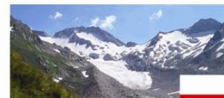
Zu Gast: Südtirol

Erwachsene € 6,- Ermäßigt € 5,- Kinder ab 6 Jahre € 2,-